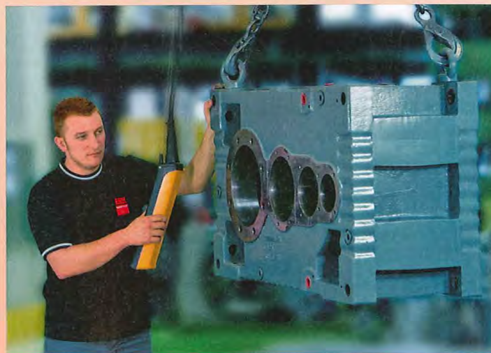
Herstelling van industriële tandwielkasten.

In Merksem zal er naast de directe serviceactiviteiten geïnvesteerd worden in een kenniscentrum betreffende het CDM Aandrijf Management. Deze door SEW op punt gestelde en beheerde internetportaal DriveGate® op www.sew-eurodrive.be laat toe de aandrijvingen in uw installatie van a tot z (met inbegrip van de belangrijke randapparatuur, tot de ganse systemen zoals pompen, rollenbanen...) in kaart te brengen en optimaal in bedrijf te houden. Merksem zal consultants ter beschikking hebben voor de opstart en het beheer van dit CDM-systeem, voor het ondersteunen van het optimaal gebruik ervan (met inbegrip van items zoals energiebe-